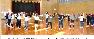
協力して完遂したイニシアチブゲーム

初めての泊を伴う行事でしたが、みんなで協力し行動する体験を通して、多くのことを学びました。同じ時間を共有し、思い出深い二日間になりました。