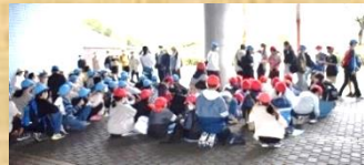
ウォークラリー全員無事に到着