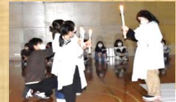
キャンドルファイヤー