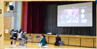
オンラインで顔を見ながら発表

中央小からは旭市の紹介を、中城南小からは中城村の紹介を合い、文化や風習の違いを知り、理解を深めました。