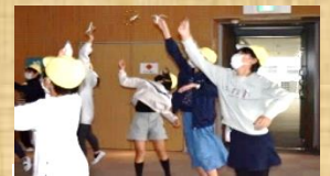
ファンタジーウイング