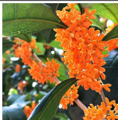
秋の訪れを感じるキンモクセイ

9月に入ってから、火、水、金曜日の放課後、音楽室からきれいな歌声が聞こえてくるようになりました。音楽部の合唱です。曲名は『365日の紙飛行機』。静かな校舎に響く歌声に「・・・時には雨も降って涙もあふれるけど 思い通りにならない日は明日頑張ろう・・・」という歌詞があります。音楽室で一生