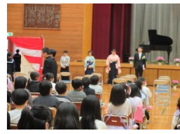
卒業生を見送る担任