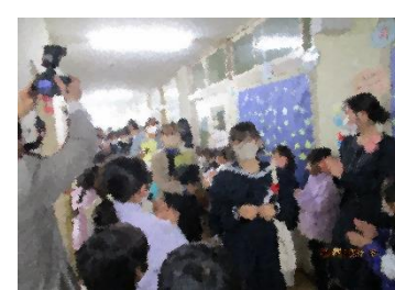
在校生や職員による見送り