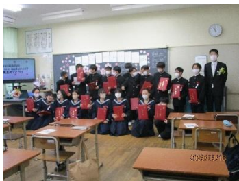
慣れ親しんだ教室で最後の記念撮影