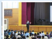
児童の前で 語る職員

また、先日の全校集会で「将来の夢」をテーマに話をした際には、3名の職員が登場し、「小学校時代の夢」について発表しました。小学校時代の夢を実現させた職員、夢に破れたけれども、努力して新たな夢を成し遂げた職員・・・一人一人の話を児童は真剣に聞いていました。