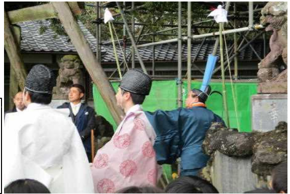
【地域行事：正月例大祭】

地域の文化財や年中行事について知り、守っていこうとする気持ちをもつことができるようにする。