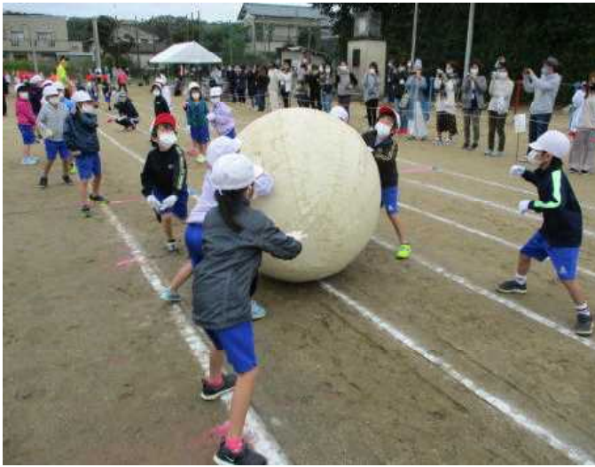
【全校大玉ころがし】

10月16日（金）にコロナ禍の中、運動会の代替行事として、スポーツのつどいが行われました。例年とは違い、コロナ対策をしっかりと行いながらの競技となりました。子供たちは、「徒競走」や「じゃんけんレース」「大玉ころがし」など限られた競技ではありましたが、元気いっぱい頑張ることができました。また、6年生を中心に競技の運営を熱心に行い、短い時間でしたが、思い出に残る行事になりました。