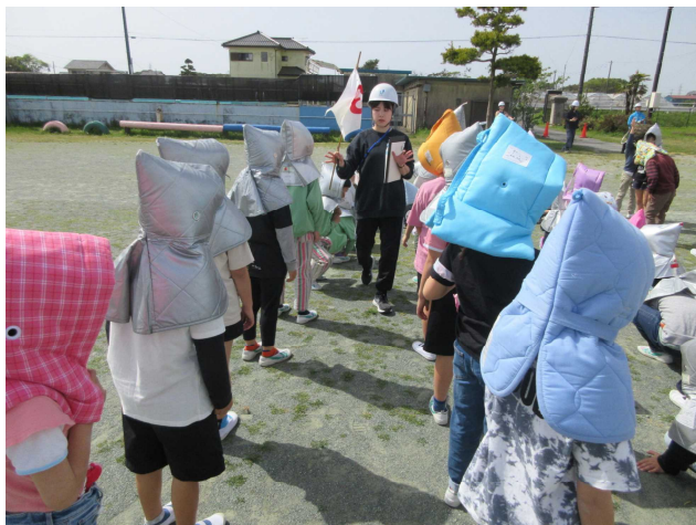
* 外に避難後、整列・点呼を行っている様子 *

4月14日(金)2校時に震度5の地震発生を想定して行いました。机の下に隠れて1次避難の後、グラウンドに2次避難しました。「お・か・し・も」を合い言葉に、落ち着いて行動できました。