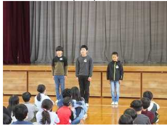
【結団式: 部長・副部長の紹介】

体力向上を目指し、今年度から4～6年生で練習を行うこととしました。初日は、あいにくの雨模様でしたが、体育館で元気に練習をスタートしました。