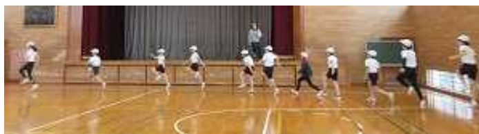
【放課後: 体育館で基礎練習から行いました】