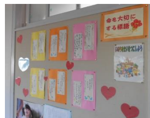
職員室の廊下に 掲示してあります。