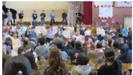
1～3年生による 村祭り・オメデトサンバ