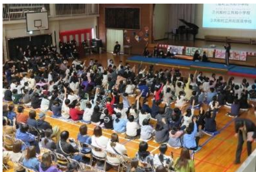
共和小歴史クイズ で大盛り上がり