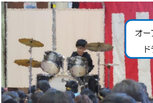
オープニングの ドラム演奏

11月14日（金）創立150周年記念集会が開催されました。ドラム演奏でのオープニングで幕が開けた「おめでとう集会」、たくさんのお家の方や地域の方にもお越しいただき、6年生が中心となって運営する集会をご覧いただくことができました。子ども達は、緊張しながらもとても張り切って練習の成果を発揮していました。前日（創立記念日当日）の資料展示でも懐かしそうに写真を見たりアルバムを広げたりしている方も多く見られ、共和小の伝統の重みを感じた2日間となりました。集会開催にあたり、多くの皆様にご支援・ご協力をいただきましたことに感謝いたします。