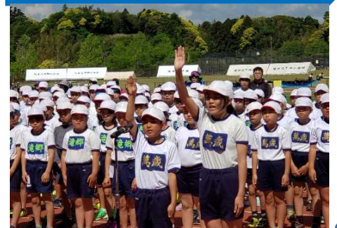
「旭市小学校体育大会選手宣誓」