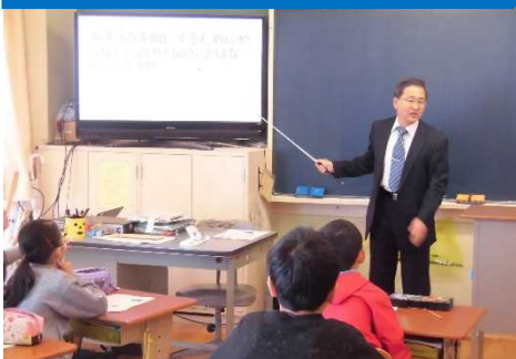
「地域の方が講師の授業」