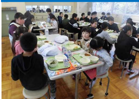
「ランチルームでの交流給食」