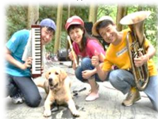
クッキーハウスの皆さん