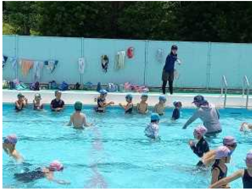
低学年 1年生は初めてのプール

夏休み中のプール開放はありませんが、民間のプールや海水浴、川遊び等に行く場合は、水難事故には十分気をつけ、楽しんでほしいと思います。また、子どもたちだけで川、海、用水路、ため池等で絶対に遊ばないように、ご家庭でも協力をお願いします。