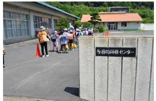
多目的研修センターへ避難

実際には、(風)雨が強まる中、子どもたちが研修センターへ移動すること自体が危険な場合も想定されます。このような事態を防ぐためにも、土砂災害を含む大雨警報が発令される前や直後においても、学校での引き渡しをお願いする場合がありますのでご承知おきください。保護者の皆様には、平日のお忙しい中にもかかわらずご協力いただき、ありがとうございました。