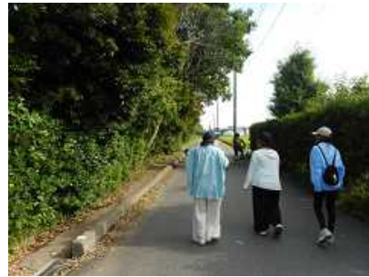
学校近くの通学路 雑木が歩道や車道に…