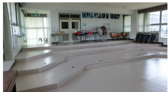
床の張替えを行った音楽室