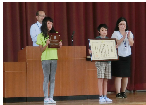
三川っ子代表児童に表彰状と楯を授与