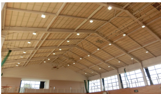
LED照明が設置された体育館