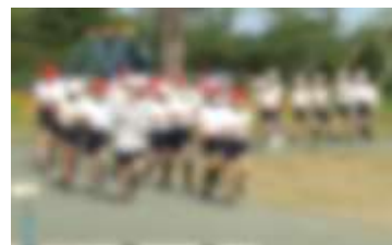
陸上部の練習風景

5月は、4月の疲れや大型連休の影響などから、特に連休後に気持ちが整わず、体調を崩したり不安感が増してしまったりすることがあります。お子様の様子で心配な面がありましたら、学校までご相談ください。また、暑い日も増えてきます。熱中症予防の意識も持ちつつ、引き続き、お子様の健康管理に気を配っていただきますようお願いいたします。