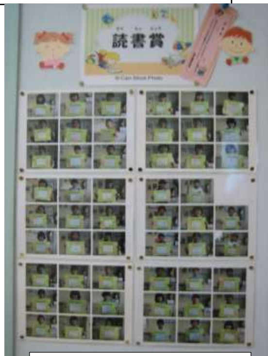
読書賞をもらった人の写真です。

自己申告制なので、すでに8回授与された子もいますし、たくさん本を読んでいても読書通帳に書かない子や書いてあっても申告しない子もいるかもしれません。子供達が読書を少しでも好きになるよう励ますために実施しています。たくさん本を読んでますます賢く、ますます心の豊かな子供に育ててほしいと考えています。