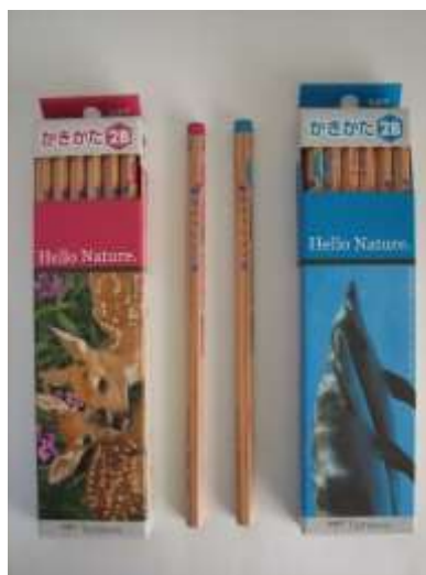
読書賞の賞品（2Bの鉛筆1本）です。

読書通帳です。読書の貯蓄ができるようになっていきます。読書通帳の貯蓄が一定数貯まり、申告すると読書賞がもらえます。