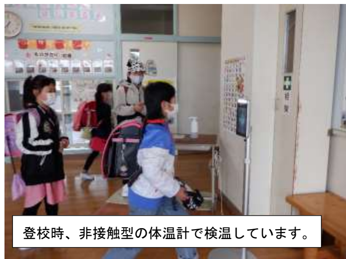
登校時、非接触型の体温計で検温しています。

しかし、自宅で健康観察をし、体温を測ってくる対応に変わりはありません。登校前にご家庭で健康観察を行い、発熱や体調不良のお子様は登校を見合わせるようお願いいたします。