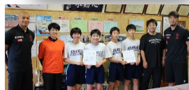
バスケットボール部に色紙をいただきました